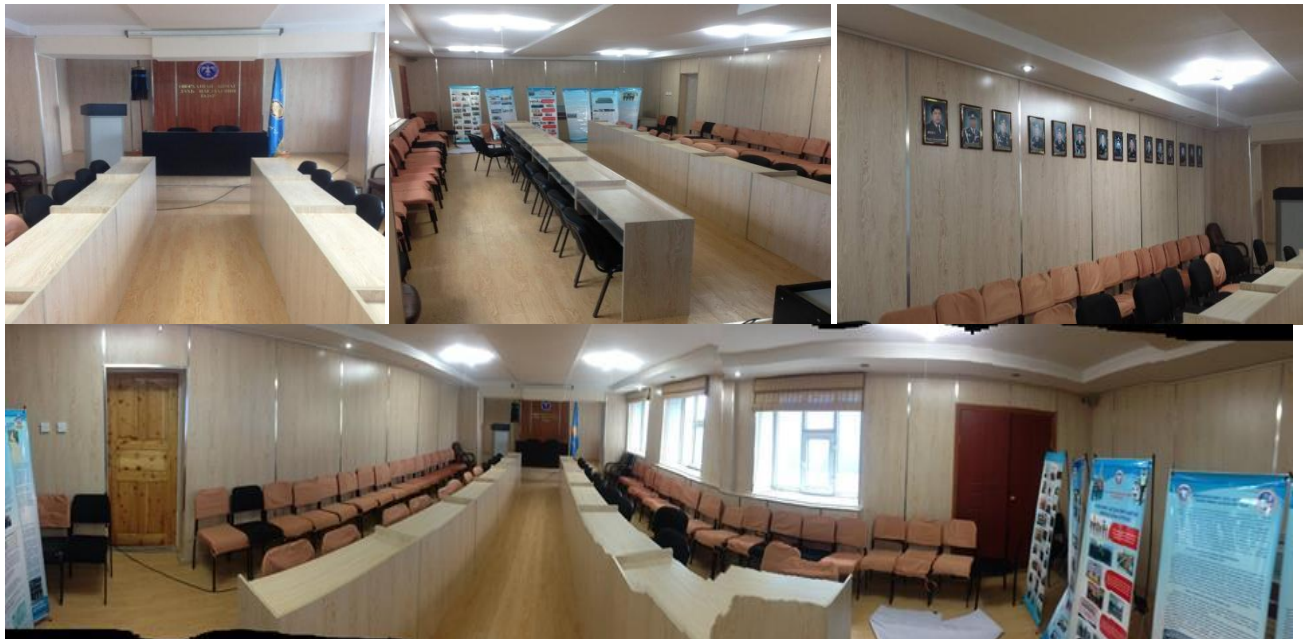
Эрүүгийн цагдаагийн тасгийн хамт олон хурлын заалыг иж бүрэн тохижуулав