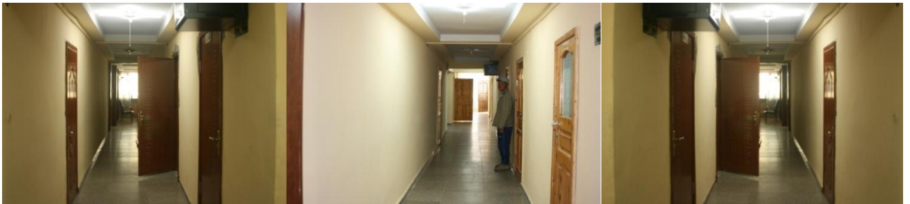
НХЖХТ-аас цагдаагийн газрын байрны нэг хоёрдугаар давхарыг засаж тохижуулав.