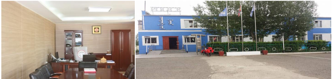
Цагдаагийн газрын гадна пассад, газрын даргын өрөөг Улаанбаатар хотын “Мэргэд групп” ХХК-аар засварлаж тохижуулав.