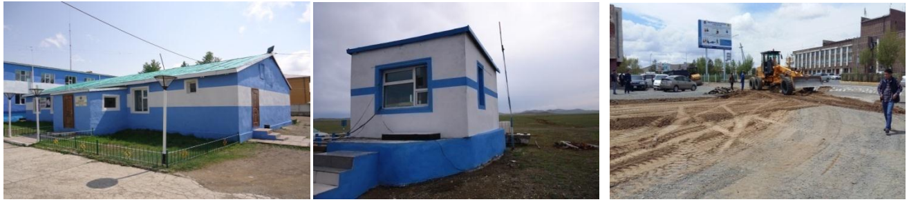
Замын цагдаагийн тасгаас замын цагдаагийн байр, Онгийн гол дахь замын цагдаагийн постын байр, цагдаагийн газрын гадна зам талбайг тохижуулав.