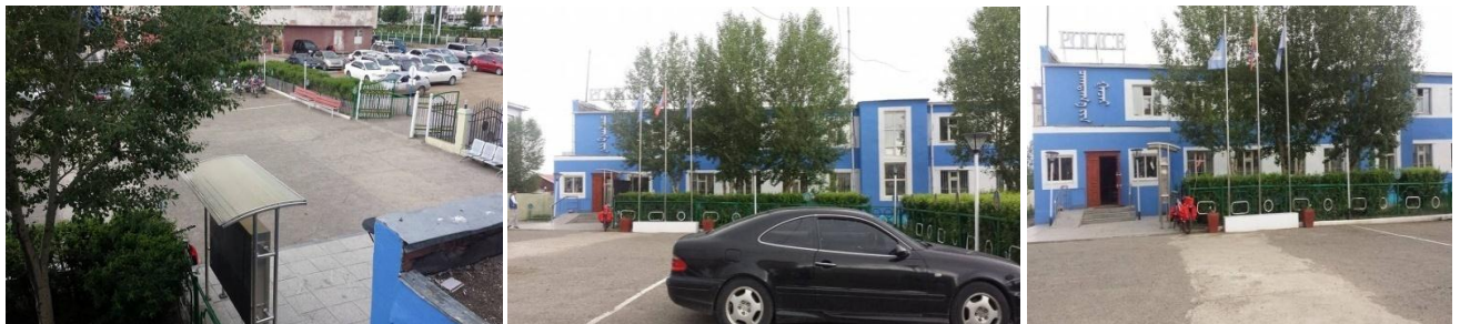
ТЗБ-ын тасгаас цагдаагийн газрын гадна орчныг засаж тохижуулав.